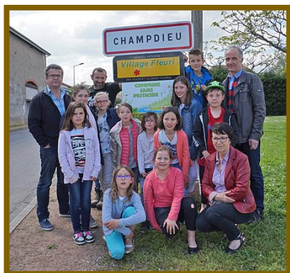
Installation de panneaux « Commune sans pesticide » à Champdieu

20 janvier 2016 : Installation de panneaux « Commune sans pesticide » à Saint-Jodard.