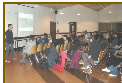
Conférence-débat « La nature dans ma ville » à Ambérieu-en-Bugey

24 juin 2016 : Signature de la charte par la commune de Neuville-sur-Ain dans le cadre du programme d'actions du syndicat de la basse vallée de l'Ain.