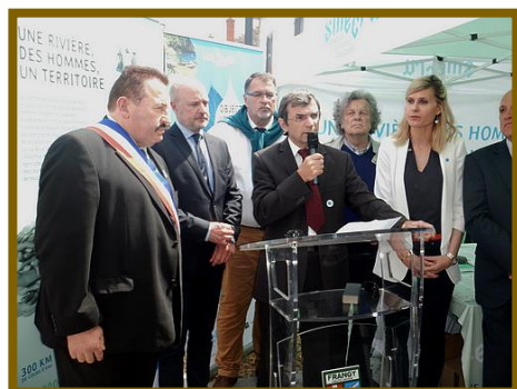
Signatures de la commune de Duingt (en haut) et des 29 communes du bassin des Usse (en bas)