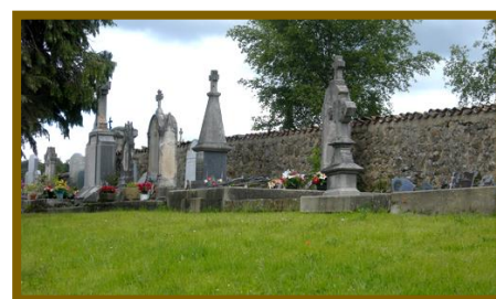
Cimetière enherbé de Saint-Pal-de-Mons

16 juin 2016 : Signatures de Saint-Ferréol-d'Aurore, Saint-Pal-de-Mons et Saint-Romain-Lachalm dans le cadre du contrat de rivière Semène.