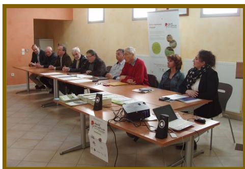
Signatures de 4 communes des bassins versants Ay-Ozon